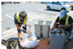
タバコの吸い殻や空き缶のゴミ回収。