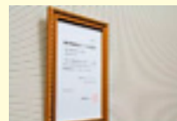
認定証は応接室に飾っています。