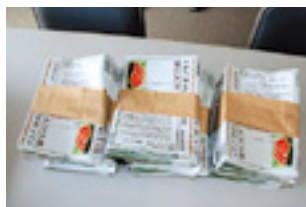
まずは、広報紙を折る作業から実施。