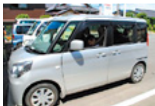
商品宅配サービスのサポートもしています。