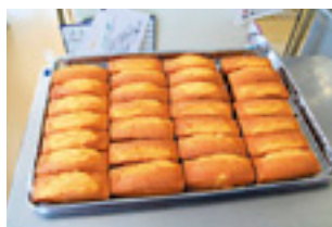
焼き上がりのパウンドケーキ。