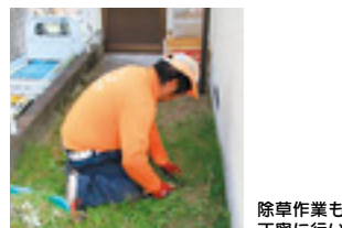
除草作業も丁寧にいきます。