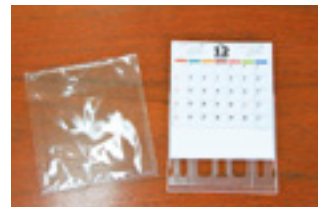
卓上カレンダーをケースに入れ、袋詰め。