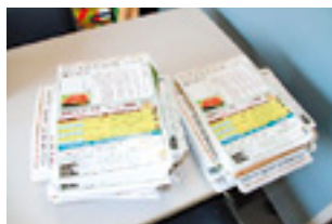
ポスティングをするための広報紙。